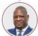
Álvaro Massingue Presidente (CCM)